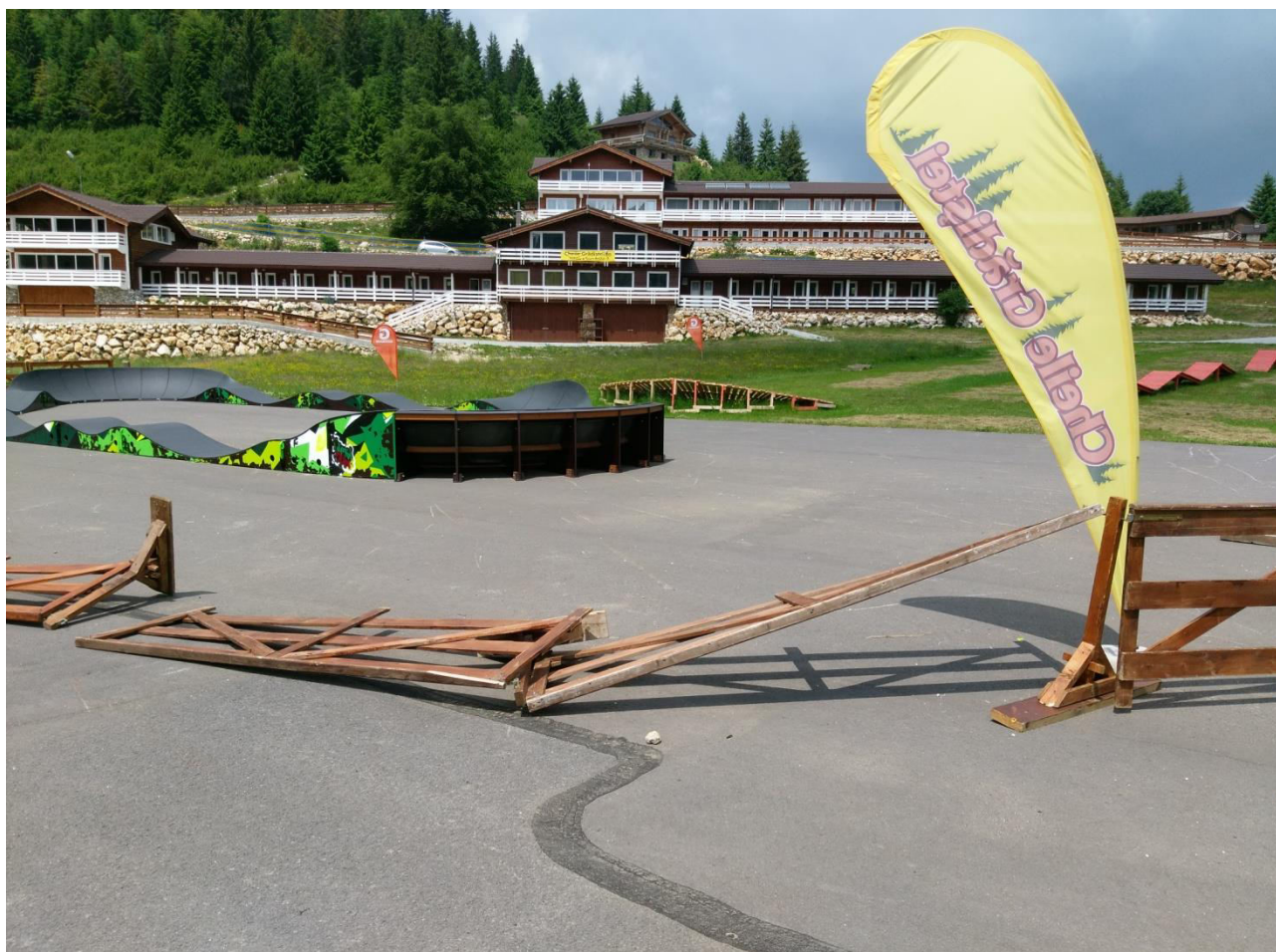
*zona de start pentru circuit

Taxa de înscriere este GRATUITĂ la aceasta competiție.